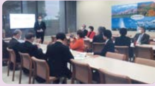
▲ 東京電力福島第一原発事故によるアルプス処理水の海洋放出に関する現状と課題、対策について学習会に参加