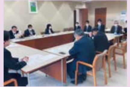
▲ 広域防災拠点について県担当者を招き説明を受け意見交換