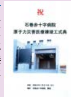
石巻赤十字病院、原子力災害医療棟竣工式典参加