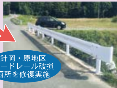
針岡・原地区ガードレール破損箇所を修復実施