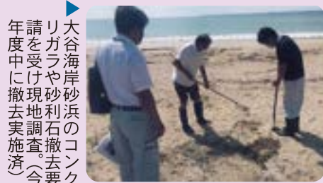
大谷海岸砂浜のコンクリート撤去要請を受け、今年度中に撤去実施