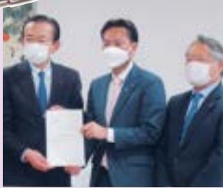
▲ 政治倫理の確立に関する検討委員会の検討結果について正副委員長で議長に報告