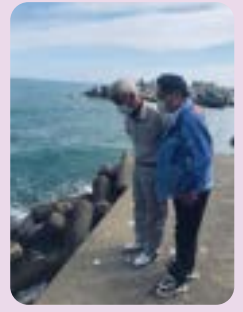
雄勝熊沢漁港整備について地元・市関係者と現地調査