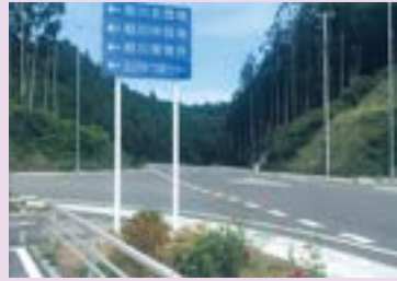
国道398号線、北上相川地区の案内板設置